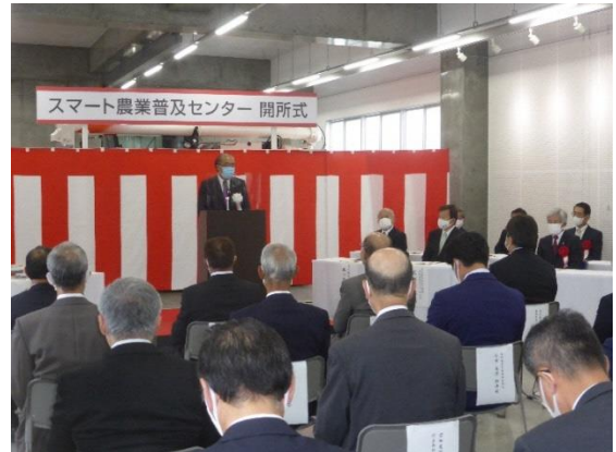
開所式（知事あいさつ）

今後は、これまでの農耕用大型特殊、農耕用けん引車両免許等の運転技術講習を実施するとともに、新たに拡充した設備を効果的に活用し、大規模経営体や将来の農業を担う若い農業者に対して、スマート農業技術の普及・啓発を図ってまいります。