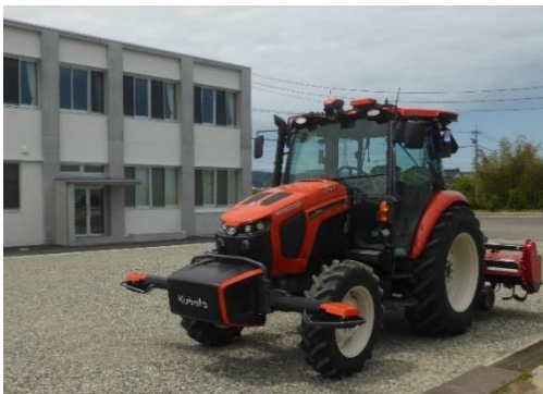
ロボットトラクタ