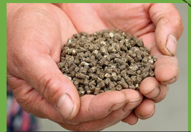
海藻アルギットを含んだ肥料

「アルギット」とはノルウェーの美しい海で育ったビタミン・ミネラルなどを含む「世界で最も品質が良い」といわれる海藻。その海藻「アルギット」を含んだ肥料を使用して育てた「にら」。肉厚な葉と甘みの強さが特徴で、全国の販売先からの評価も良く、高い需要を誇ります。