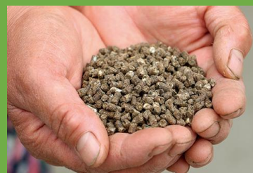
海藻アルギットを含んだ肥料

肉厚な葉と甘みの強さが特徴で、全国の販売先からの評価も良く、高い需要を誇ります。