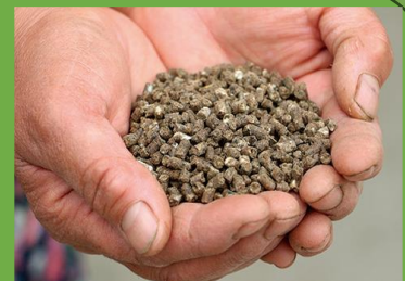
海藻アルギットを含んだ肥料

「アルギット」とはノルウェーの美しい海で育ったビタミン・ミネラルなどを含む「世界で最も品質が良い」といわれる海藻。その海藻「アルギット」を含んだ肥料を使用して育てた「にら」。肉厚な葉と甘みの強さが特徴で、全国の販売先からの評価も良く、高い需要を誇ります。