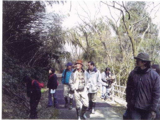
里山の春を満喫『早春散策会』