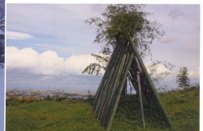
富山湾を望むく竹ウイング