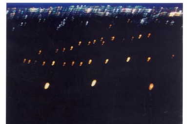
竹灯籠と夜景の灯火