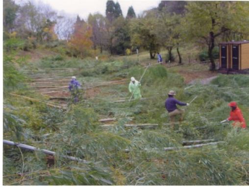
侵入竹の伐採整理と竹材の採取活動