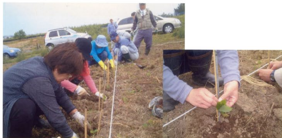
「森の稚樹苗」育成活動

「呉羽丘陵『森の楽校』」は、呉羽丘陵の失われつつある里山の魅力を伝え、保全と活用について考え、行動する市民グループです。