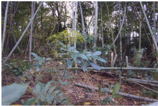
竹を伐採すると稚樹達が顔を出した