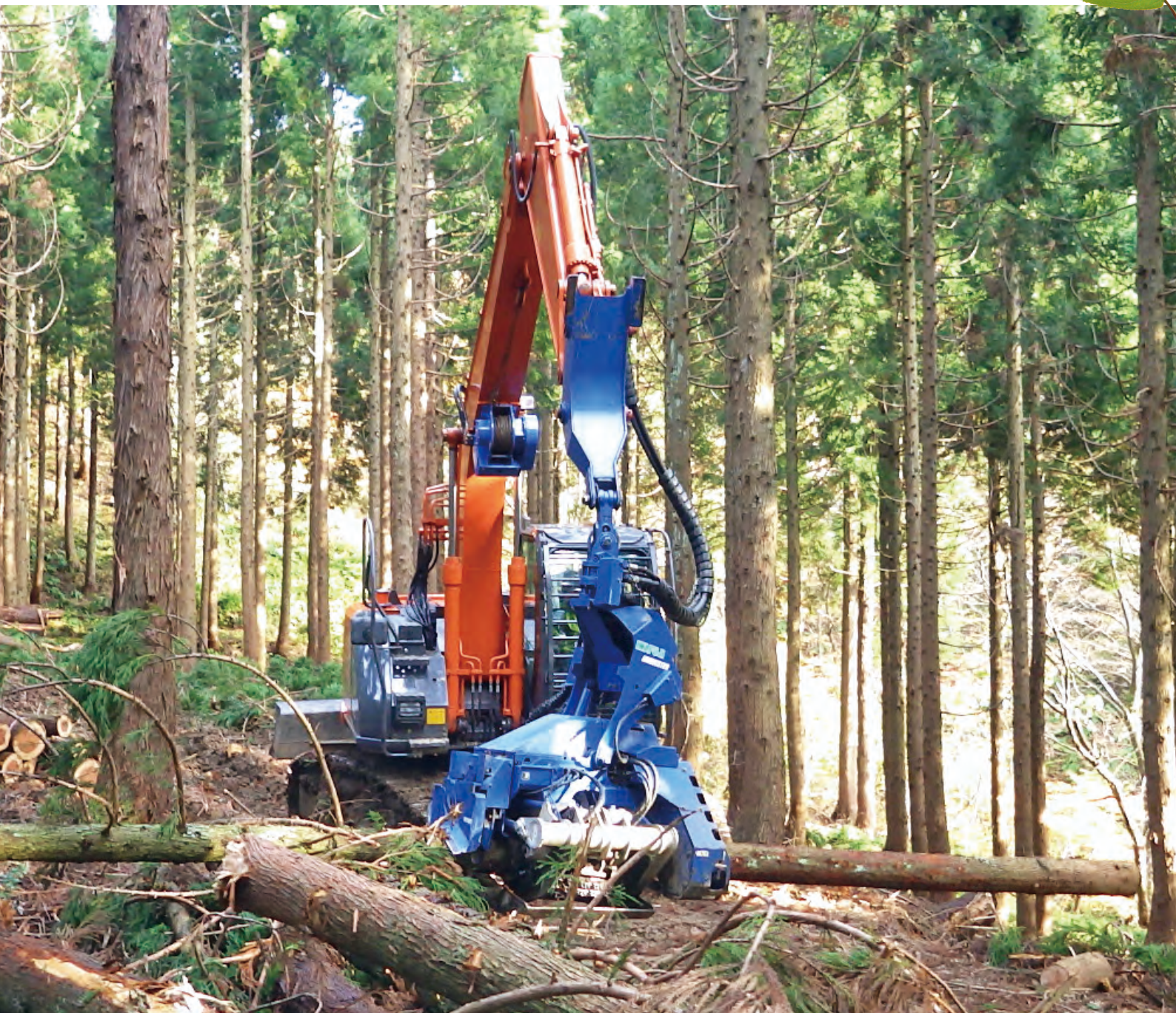
魚津市坪野(I)事業地内

発行／富山県「美しい森林」事業推進協議会 URL : https://www.taff.or.jp/utukushiimori/