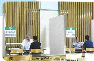
研修生と法人経営者との交流会