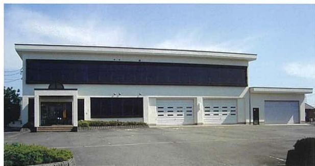
左) とやま農業未来カレッジ本校舎 右) 上：環境制御型園芸ハウス 下：管理棟