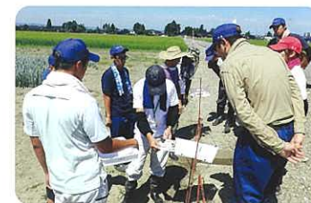
トラップで捕らえた害虫の調査

カレッジの専任指導員をはじめ、県の研究員・普及指導員、農業高校教員、先進農家、大学関係者、農業機械・ICT等の専門家等充実した講師陣が指導します。