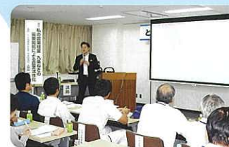
国内の専門講師による公開講座